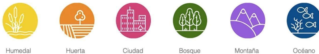
Figura 2. Principales sistemas socio-ambientales de la región

El programa consta de cuatro encuentros sincrónicos , en tres de los cuales participan estudiantes. Además, incluye un proceso de acompañamiento experto (científico-intercultural y periodístico) para apoyar al docente y estudiantes en las etapas de idear y testear de la ruta de aprendizaje.